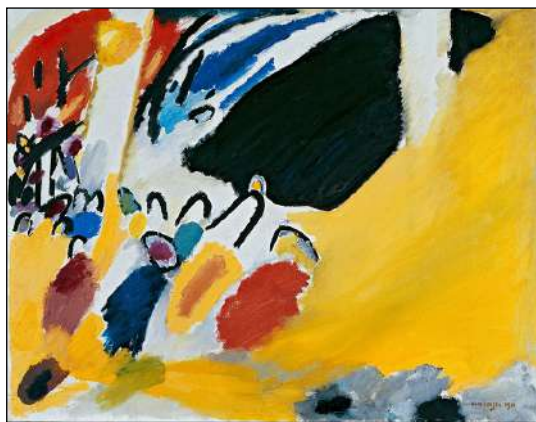
Impression III (Concert), olio su tela di Vasilij Vasil'evic Kandinskij (1911), Monaco Lenbachhaus

Secondo Skrjabin, quando si riusciva a percepire il cromatismo giusto, accompagnato dal suono corretto, si generava una sorta di sintonizzazione