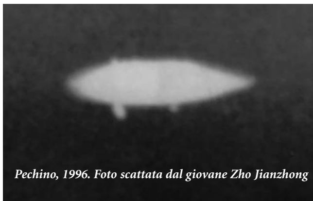
Pechino, 1996.

Settembre 1998. Scoppia il panico su un Boeing 767 partito da Pechino con 270 passeggeri a bordo, destinazione Shanghai. “Improvvisamente ci si è parato davanti un disco a forma di piatto che è sfrecciato a velocità incredibile sopra di noi, a non più di cento metri di distanza”, racconterà uno dei piloti, Ming Shengli. “In quel momento ho avuto difficoltà a mantenere il controllo dell'aereo. Abbiamo perso velocemente quota prima che riuscissi a riportarlo nel giusto